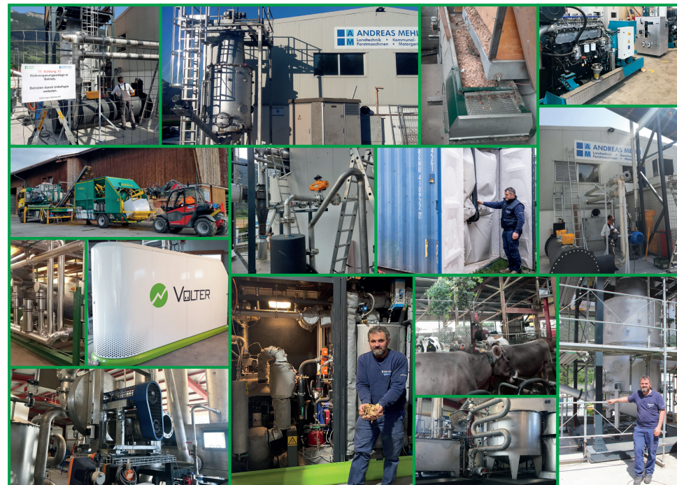
Blick in den aktuellen Anlagenpark mit bereits einer grossen Vielfalt von Anlagen zur Produktion erneuerbarer Energien

Das Gesamtprojekt wird in 3 Etappen aufgeteilt. Projektbeginn: März 2024, vorgesehener Projektabschluss über 3 Etappen: Ende 2026. Das Projekt ist eine Kooperation zwischen der Klimastiftung Graubünden und der Fachhochschule Graubünden.